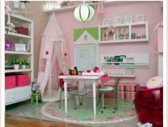
Quarto ideal para a leitura