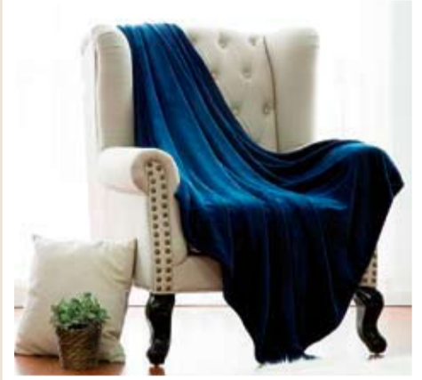
Casa de outono