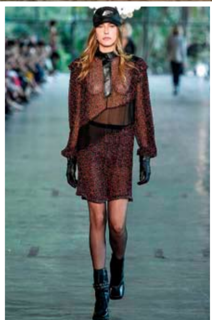
Das passarelas para as ruas

Objetivo é olhar com mais carinho para a cidade, na busca por soluções para deixá-la ainda mais especial