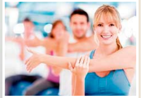
Alongar é preciso