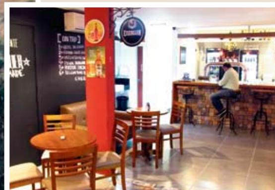
No Name é inaugurado na Rua Bocaiúva