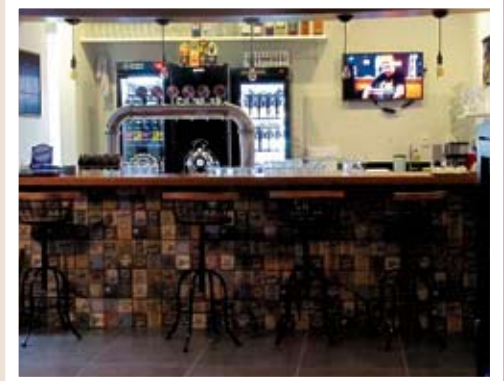
No Name é inaugurado no Centro de Floripa