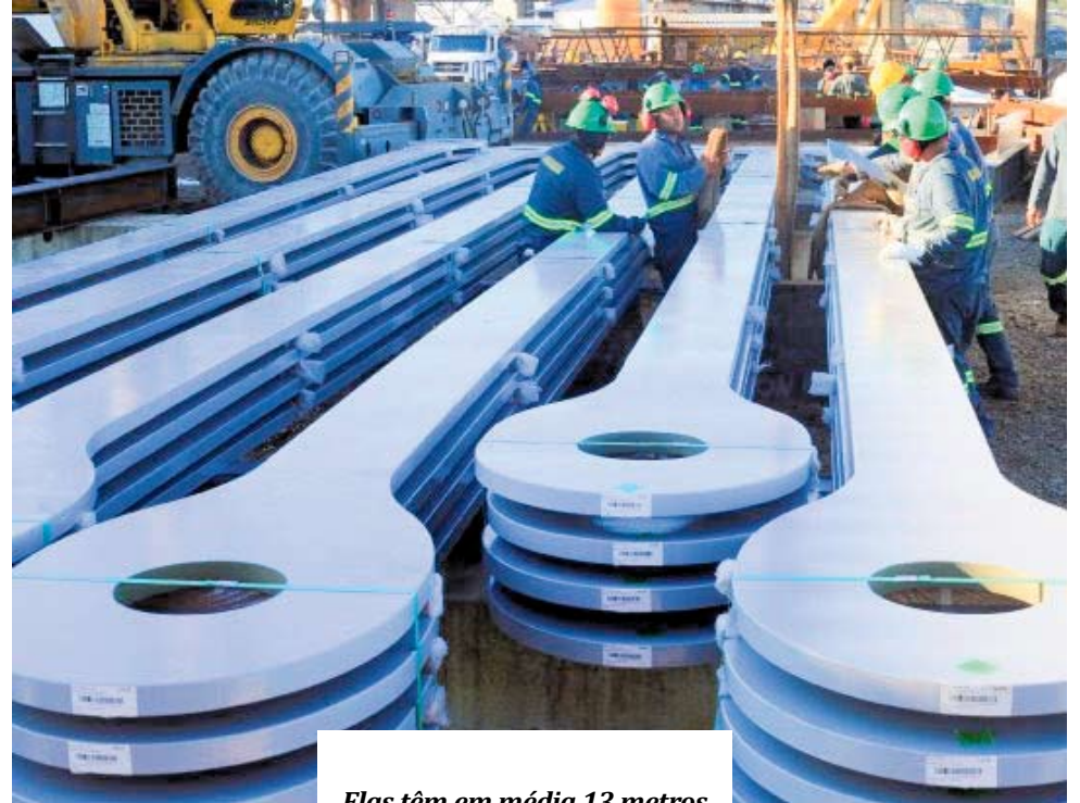
Elas têm em média 13 metros de comprimento e pesam cerca de 1,8 toneladas

A empresa Empa, do grupo português Teixeira Duarte, é a responsável pelo atual ciclo das obras de restauração. A ordem de serviço para os trabalhos foi assinada em abril de 2016, com prazo de execução previsto em 30 meses, o que aponta a conclusão das obras no segundo semestre de 2018. Quando reaberta, terá duas vias para receber veículos e espaço para ciclistas e pedestres.