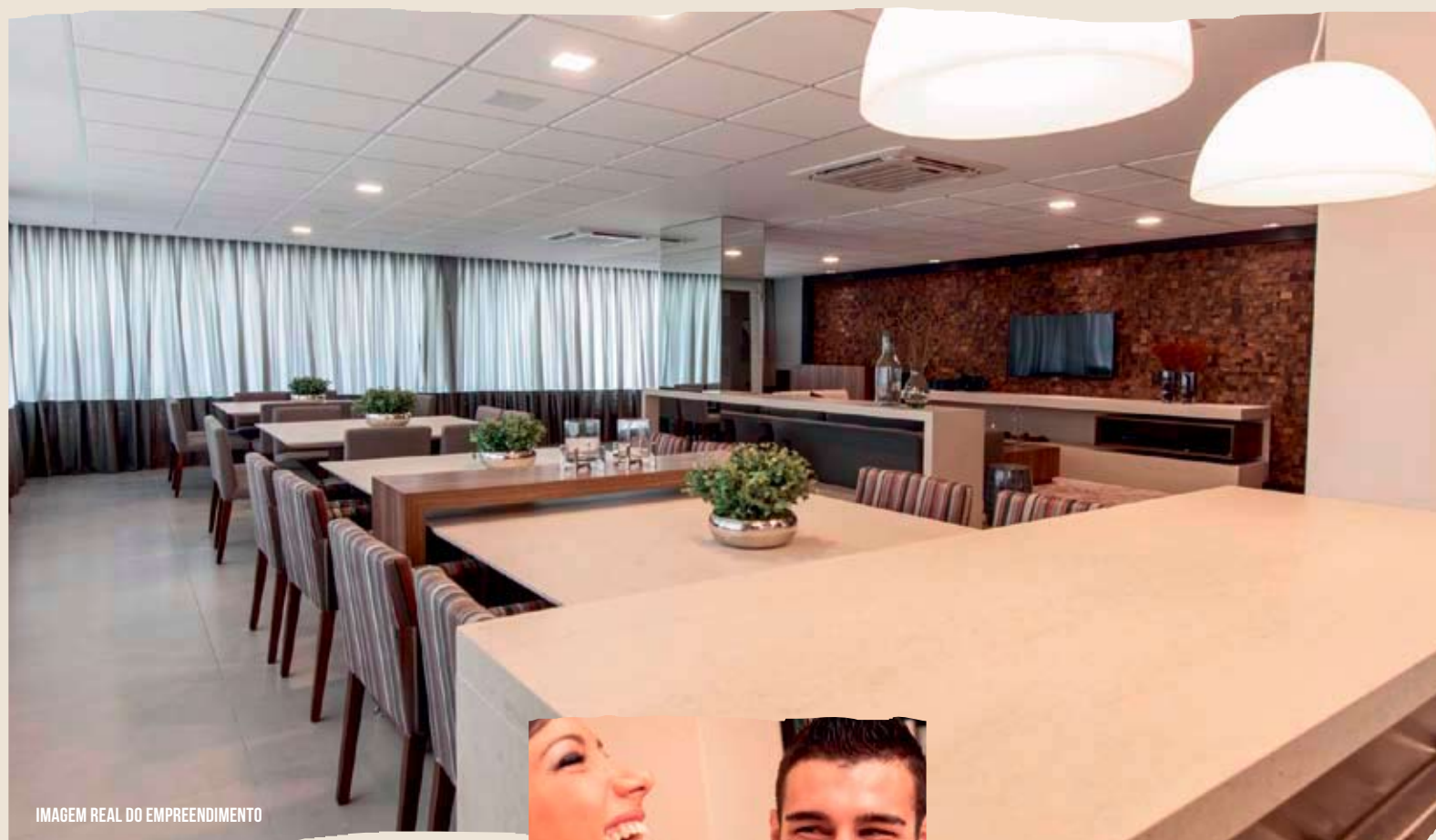
IMAGEM REAL DO EMPREENDIMENTO