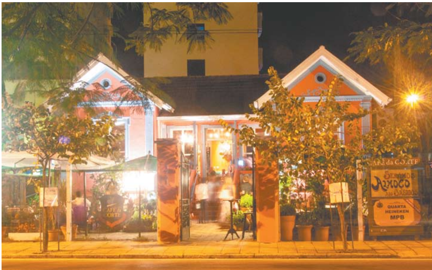
À noite, o Café da Corte fica ainda mais charmoso, oferecendo um aconchegante lounge externo

Cores fortes e vibrantes são um traço marcante da decoração. E estão em todos os ambientes: nas paredes em tom amarelo, azul e rosa blush; nas chitas em almofadas, forrando as portas dos banheiros; nas almofadas de fuxico; nos crochês. “A casa da minha avó era muito colorida, a da minha mãe também, cresci em meio a muita