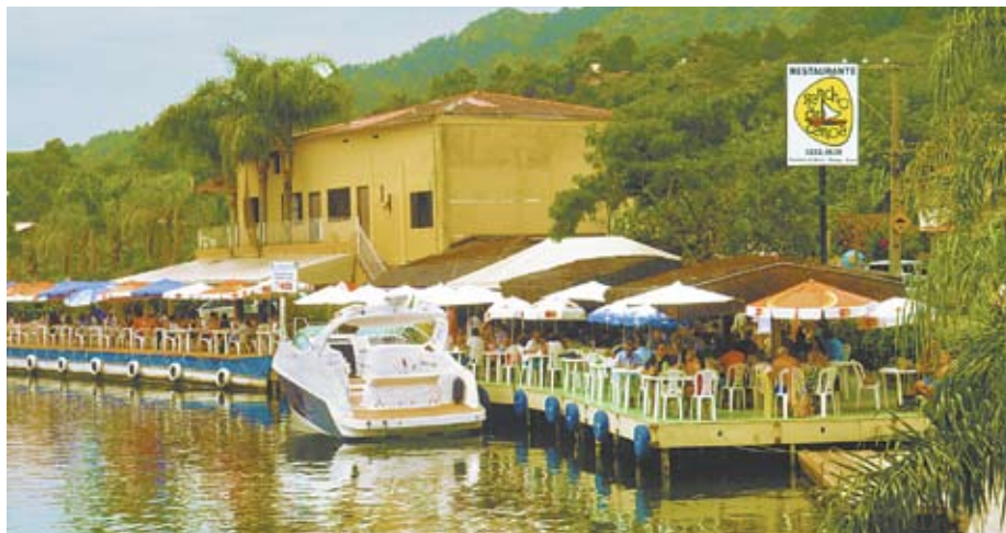
Os restaurantes do Canal da Barra estão construídos em Área de Preservação Permanente, não respeitando os 30m de distância da margem

Além de empresários e particulares, a Prefeitura de Florianópolis também é alvo de ações, motivadas em função do que o MPF classifica como “total omissão”. A de 2000, que também tem como alvo Casan e Fatma, trata da falta de tratamento adequado de esgoto na região. Analúcia Hartmann, Procuradora da República em