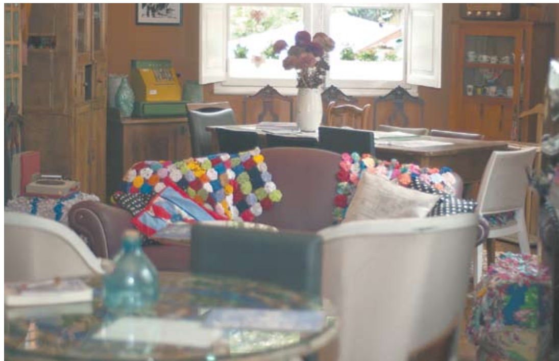
O salão principal tem ambientes para todos os gostos: mesas de vários tamanhos e muitos sofás e poltronas antigos

Na parte externa do café está um grande lounge. Internamente, são