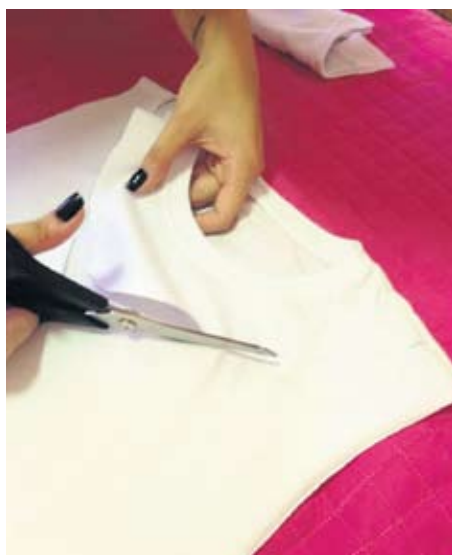
2 - Meça o ombro para saber o quanto de paetê será usado na alça.