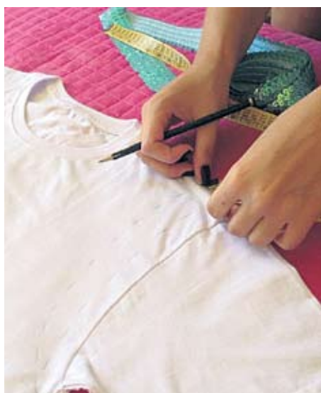
1 - Com o lápis e com o auxílio de uma fita métrica, faça a marcação do modelo que deseja e corte

Ela explica que paetês e adereços coloridos são indispensáveis para compor o look. Inclua na produção o uso de colares, brincos, óculos coloridos e, até mesmo adereços para a cabeça como flores. Na customização, aposte ainda em rendas, miçangas e correntes.