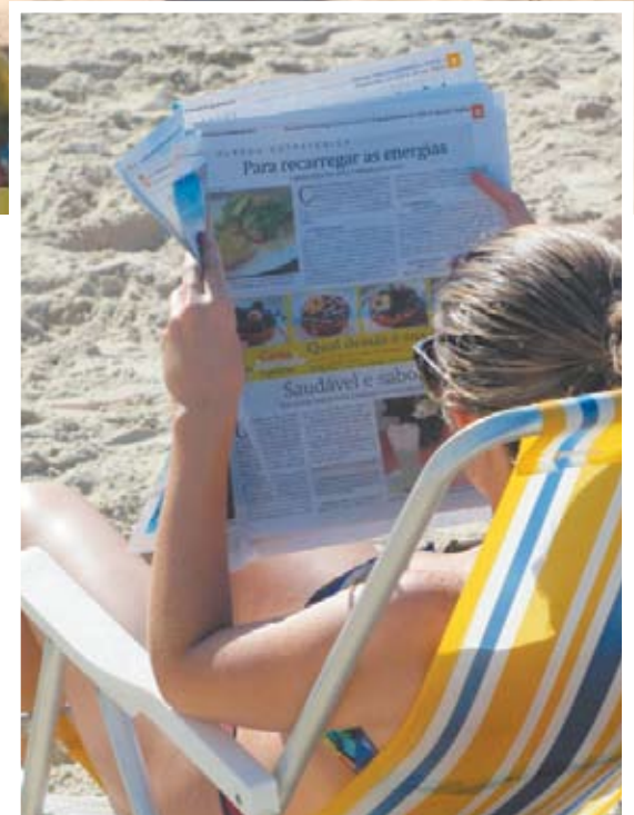
Com boas dicas, o guia de verão está se tornando leitura obrigatória durante a temporada