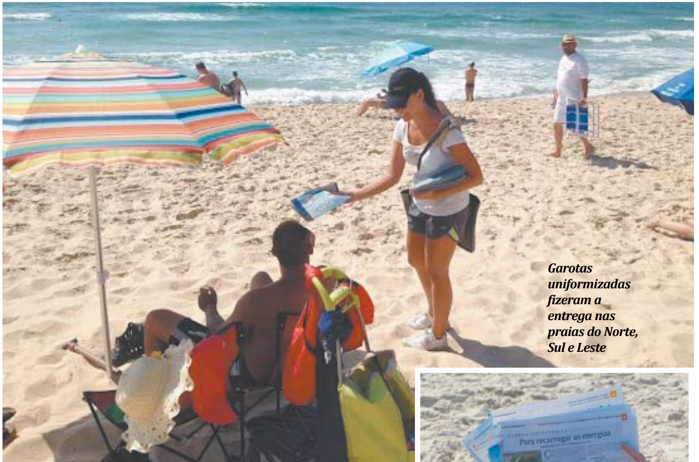
Garotas uniformizadas fizeram a entrega nas praias do Norte, Sul e Leste

Os dez mil exemplares gratuitos de cada edição foram entregues por profissionais uniformizadas nas praias de Jurerê, Ponta das Canas, Lagoinha, Praia Brava, Ingleses, Santinho, Joaquina, Mole e Campeche. Já os 30 hotéis selecionados estão localizados no Centro, na área da Beira-Mar e em algumas das praias no Norte da Ilha. “Com isso, mais uma vez diferenciamos o Imagem da Ilha dos outros veículos de circulação dirigida da cidade, garantindo aos leitores e anunciantes um produto bem-elaborado e de sucesso garantido”, finaliza Byron.