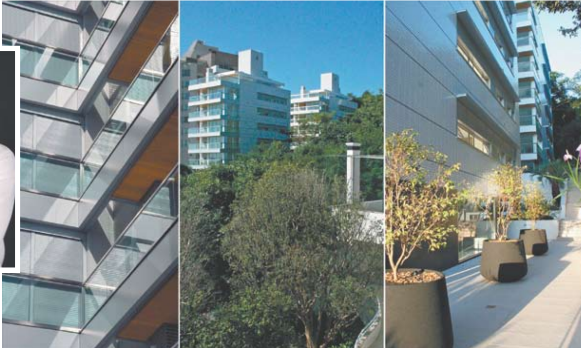
Edifício Mônaco, no bairro João Paulo, na Capital: vencedor da categoria edifício e/ou conjuntos residenciais