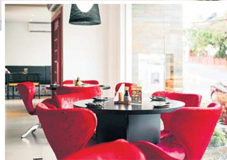
Fachada de vidro permite conhecer uma parte do lugar, atraindo a atenção