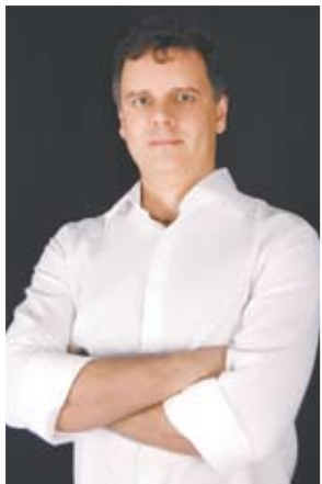
Fonseca: portfólio para os futuros profissionais

O julgamento dos trabalhos será dia 11 de março e a solenidade de premiação foi transferida para 27 de março. Depois dessa data, anuncia Fonseca, os trabalhos vencedores irão percorrer espaços públicos do Estado, em uma exposição itinerante, a exemplo do que aconteceu na primeira edição do prêmio.