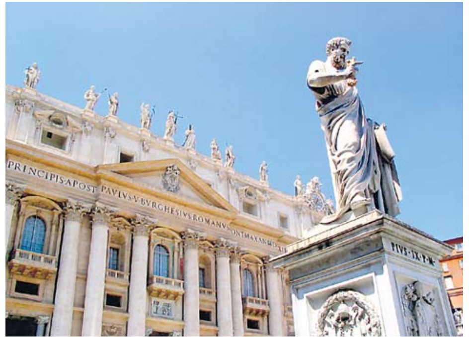
Praça São Pedro: local histórico que sediará a cerimônia de canonização

O roteiro Canonização tem saída marcada para o dia 21 de abril.