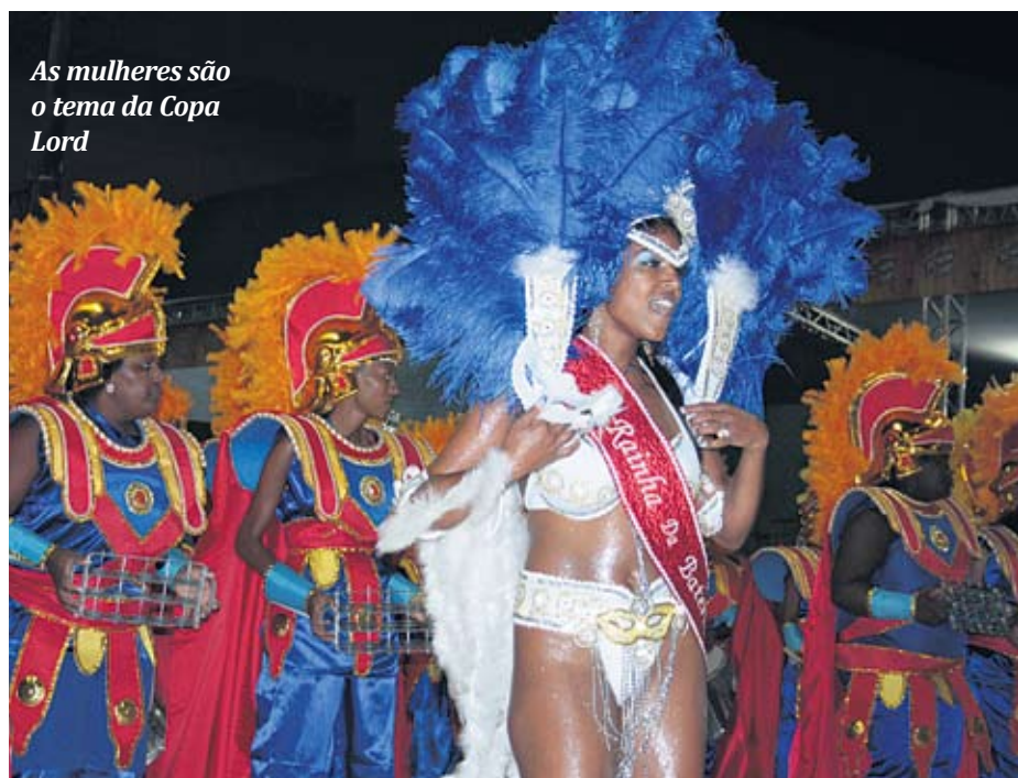
As mulheres são o tema da Copa Lord