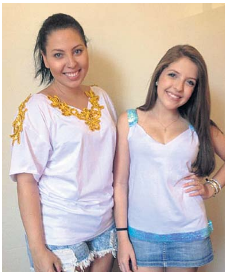
Resultado: peças únicas e confortáveis