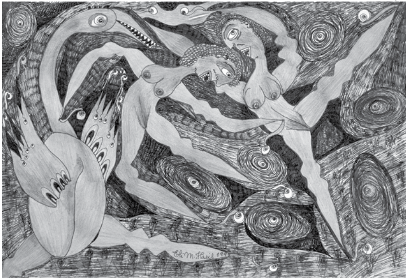
"Mulheres Dançando", grafite sobre papel de 1998

obras, de vários tamanhos, formatos e materiais, inclusive muitas delas na área externa da casa, como que protegendo, guardando mesmo a propriedade.