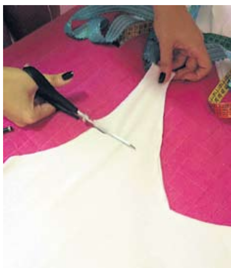
3 - Depois de medir, corte a alça da camiseta e costure o paetê. Para o auxílio da costura, use alfinetes.