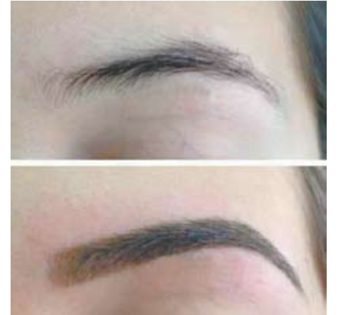
Efeito suave da micropigmentação na técnica esfumado natural, outro trabalho de Jullie