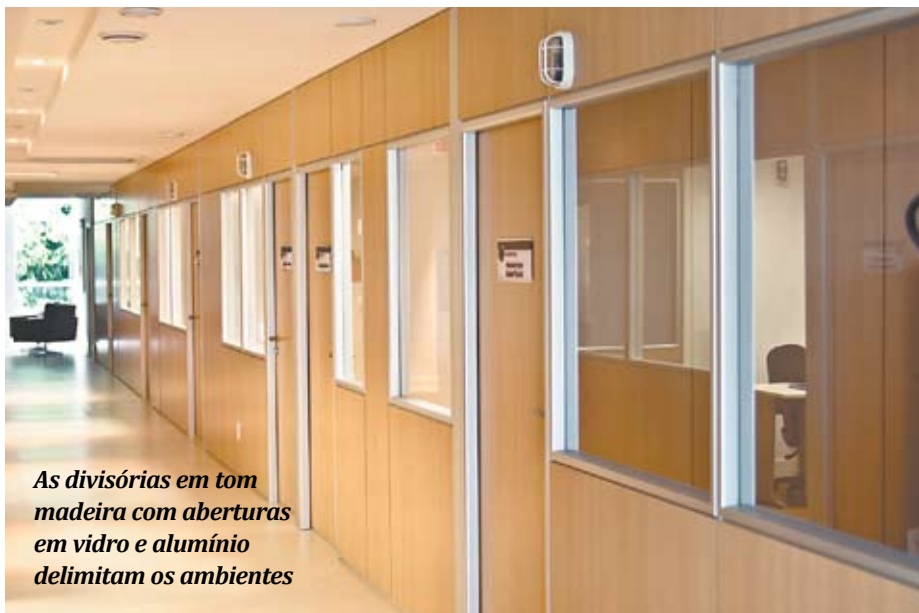
As divisórias em tom madeira com aberturas em vidro e alumínio delimitam os ambientes