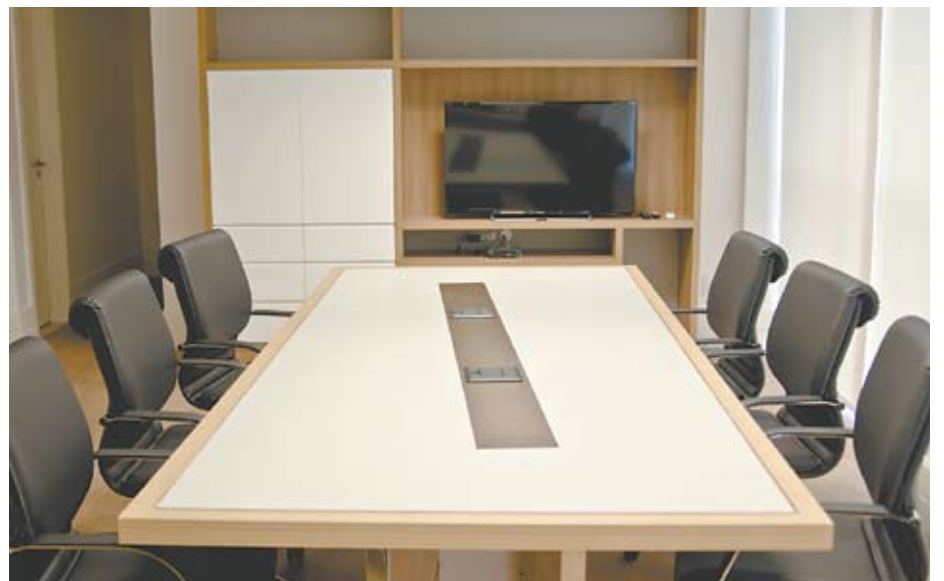
O espaço de reuniões é integrado, preservando a sua formalidade