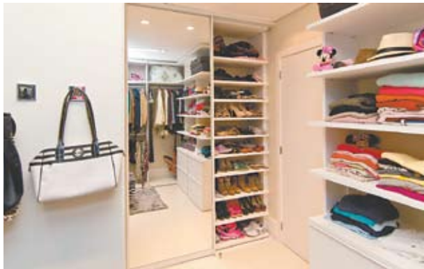
Cada irmã tem a sua suíte e compartilham o espaçoso closet (Orla Marítima)

casas ficou para o uso da churrasqueira e a outra fez as vezes de um ambiente de estar.