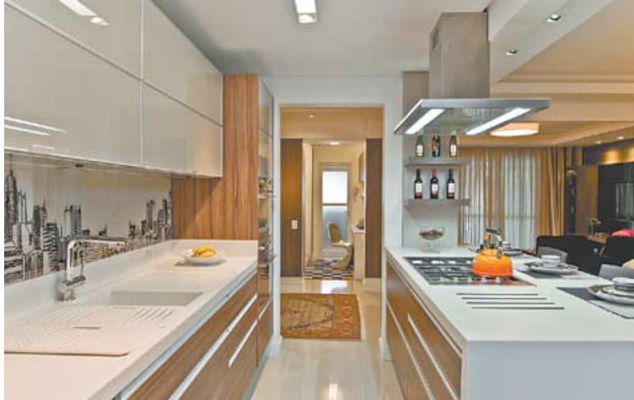
A cozinha integrada à sala ganhou modernidade com a impressão em arte no vidro e a ilha central (Porto de Bremen)

A sala foi ampliada e subdividida em estar e jantar com a cozinha integrada. A área da cozinha na planta original foi adaptada para um walk office – escritório com estante e escrivaninha. Uma das sa-