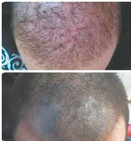
A falta de cabelos pode ser atenuada em homens e mulheres com a micropigmentação. Na foto, resultados do antes e depois de procedimentos realizados por Jullie Souza

ra para a prévia despigmentação. Por isso, ela orienta que seja feito um retoque após seis meses do procedimento. O pigmento some por completo após quatro anos.