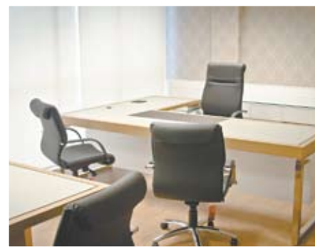
Instituição ganha mix de cores e estilo

AMBIENTES CORPORATIVOS Identidade renovada