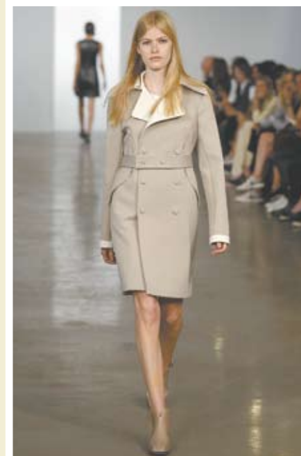
A elegância e versatilidade dos casacos