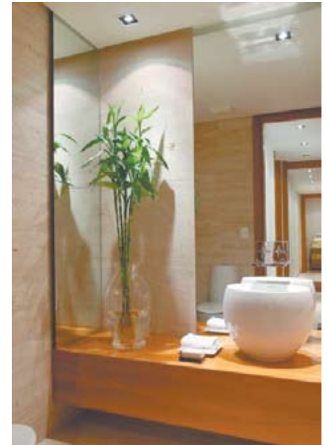
Plantas ajudam a manter a vitalidade dos banheiros, que tende a desgastar devido ao escoamento de água