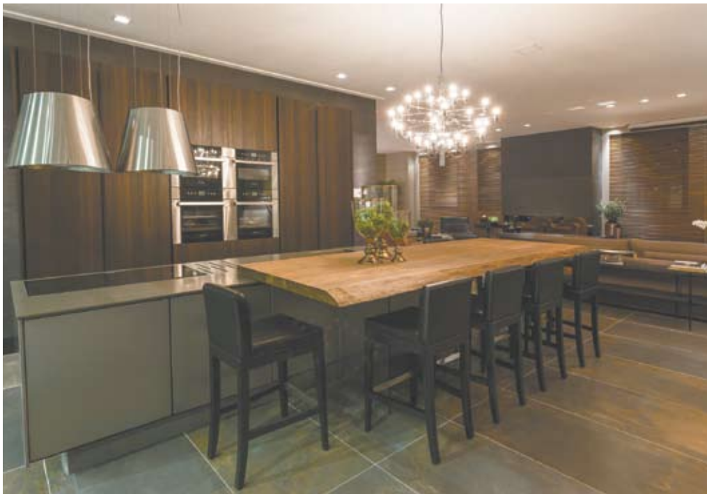
A bancada de madeira de demolição esquentou a composição sem interferir no ar contemporâneo da cozinha. Já o painel camufla o refrigerador