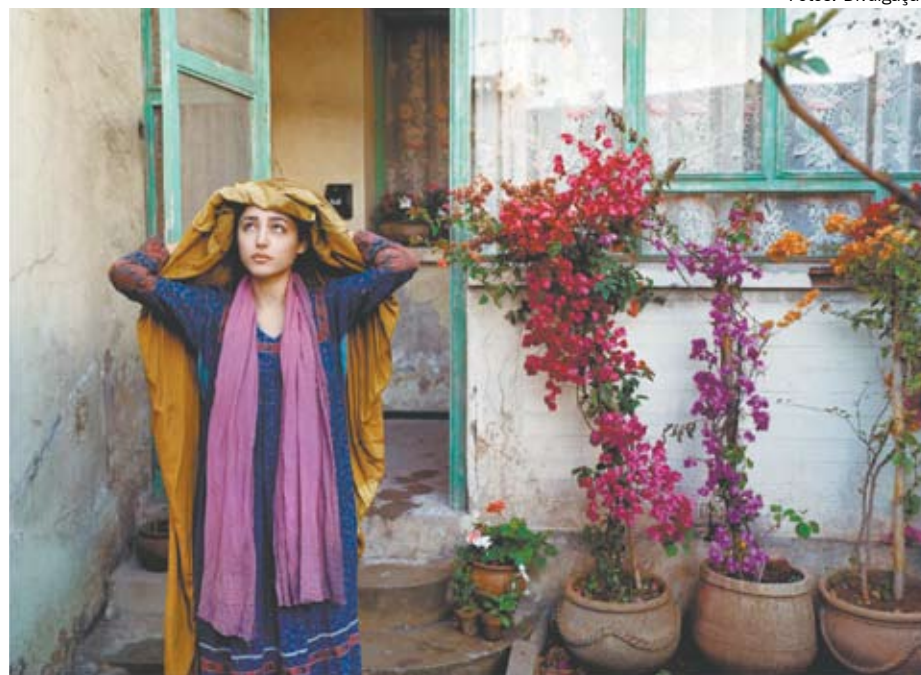
A atriz iraniana Golshifteh Farahani em show de interpretação e sensibilidade