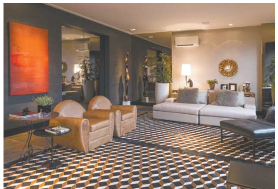
Os cômodos estabelecem diálogo aberto, traduzindo a vontade de companhia e a simplificação da vida

A bancada de madeira de demolição esquentou a composição sem interferir no ar “moderninho”. A iluminação em led é acionada quando as gavetas são abertas e ainda valoriza o recorte da adega, desenhada no padrão Nero da Evviva Bertolini, que ainda conta com portas deslizantes da Cinex. A arquiteta ainda pontua os móveis soltos da Sierra, os novos revestimentos que chegam ao mercado, como o mosaico Petlas, feito em porcelanato e madeira natural, da Mosarte e as lâminas porcelânicas, da Cosentino.