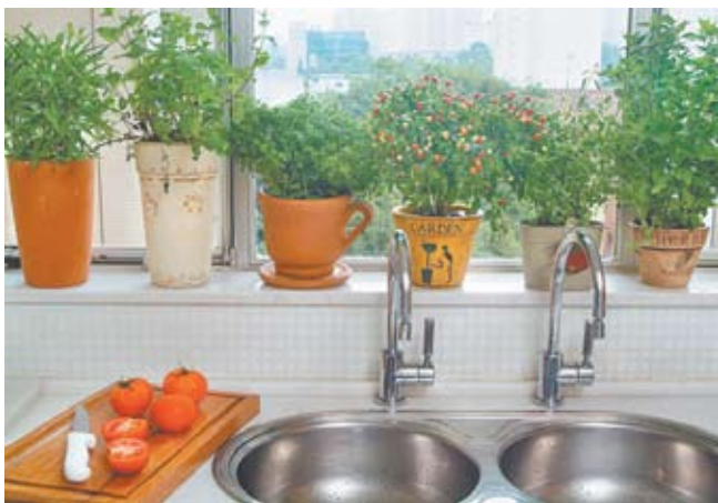
A horta na janela da cozinha auxilia no acesso aos temperos e deixa o ambiente charmoso