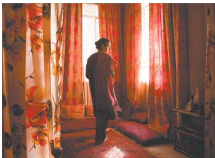
A cor e a leveza dos tecidos em contraponto ao cinza da guerra do lado de fora

Achei genial essa sacada de Atiq Rahimi de colocar um marido em coma como a razão para que a mulher possa dizer aberta e livremente o que sente. Genial porque em que outra situação uma mulher muçulmana teria essa oportunidade? Genial também porque dessa maneira conseguiu construir um monólogo elegante e cheio de suspense – claro, a qualquer hora o marido