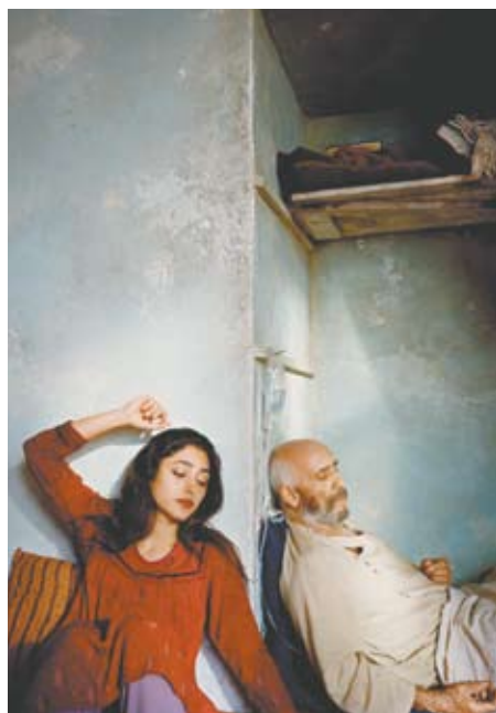
Vigília e confissões a um marido em estado de coma