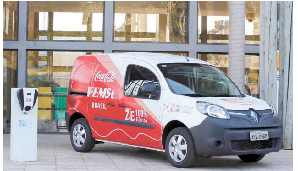
Veículo é equipado com um pacote de baterias que permite rodar 170 km com uma só carga e pode ser recarregado entre 6 e 8 horas

Com quatro modelos, a Renault é o único grupo automobilístico mundial