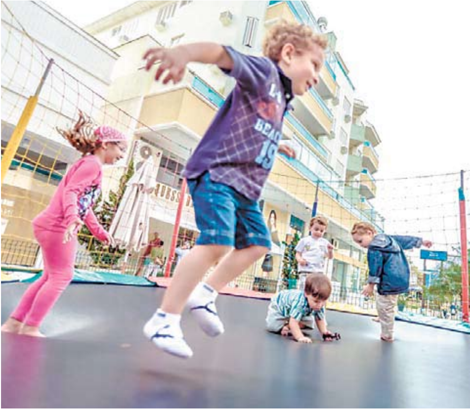
De cama elástica a cineminha: opções só para os pequenos e também lazer com os pais

Programação infantil é destaque durante toda a temporada em Jurerê Internacional