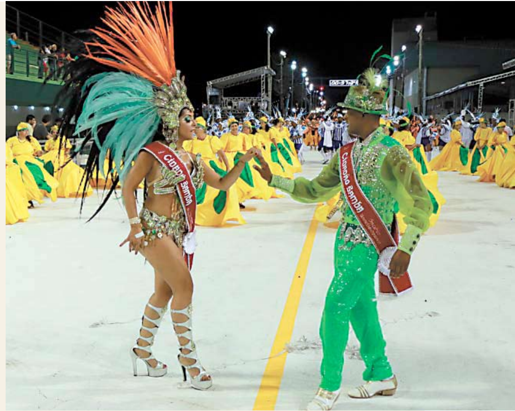
Escolas de samba da cidade iniciam seus desfiles na sexta-feira, 05/02

O valor dos ingressos varia de acordo com o setor da Passarela. Ao todo são 10 setores, com ingressos de R$ 30,00 (quatro noites) a R$ 10 mil, para grupo de 25 pessoas, e podem ser adquiridos pela internet no site www.ticmix.com . Não haverá comercialização de ingressos na Passarela Nego Quirido.