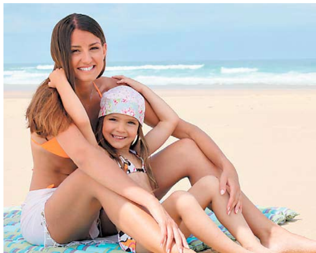
Uma das principais dicas é estar sempre ao lado da criança