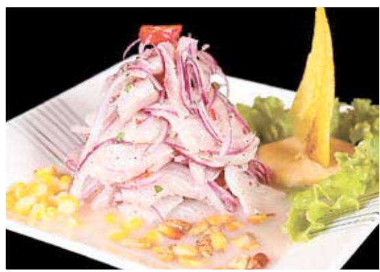
Ceviche é opção da culinária peruana